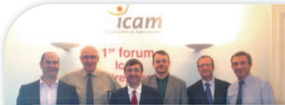
L'équipe des directeurs de l'Icam :

Vous possédez grâce à la taxe d'apprentissage un formidable levier pour nous aider à relever ces défis et à continuer nos projets. Nous comptons sur vous et nous vous remercions par avance.